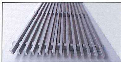
Illustration 1 Grille équipée (haut) et sans (bas) filtre